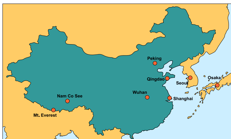
Standorte der Klimaforschung im tibetischen Hochland: Messstationen in der Mt. Everest-Region und am Nam Co See