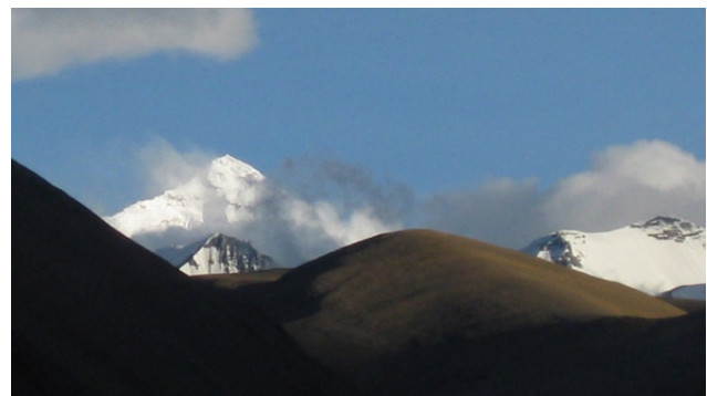
Mt. Everest, vom Messfeld der Messstation aus gesehen (Zoom)