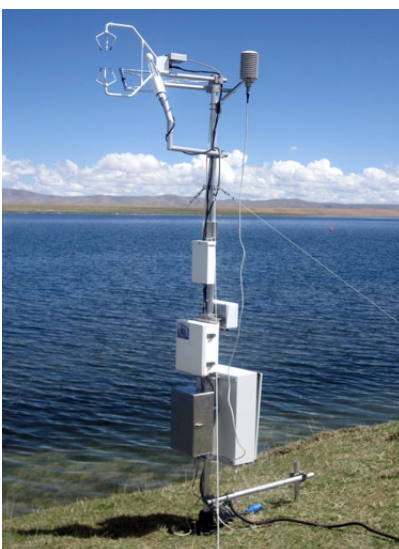
Energiebilanz-Messstelle am Nam Co See

Ein Höhepunkt der Expedition waren die Forschungsarbeiten am Nam Co See, dem höchstgelegenen Salzwassersee in China. Der See liegt in einer Höhe von 4700 m und hat eine Ausdehnung von knapp 2000 Quadratkilometern. Sein Name bedeutet auf tibetisch „Himmlicher See“; im tibetischen Buddhismus gilt der See als heilig und ist eine bedeutende Pilgerstätte. Die Bayreuther Klimaforscher haben am Ufer eine Messstelle eingerichtet, die windrichtungsabhängig sowohl Daten vom See als auch von Grasflächen erfasst. Es handelt sich dabei um die ersten direkten Verdunstungsmessungen, die bisher am Nam Co See vorgenommen wurden. Seit Ende Juni und noch bis Mitte August 2009 liefert die Messstation Informationen, die Rückschlüsse auf die natürliche Energiebilanz in der Region ermöglichen. Bei den Messungen kommt u.a. auch ein Kryptonhygrometer zum Einsatz, d.h. ein Instrument, das